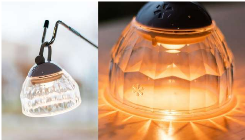
画像説明：スノーピーク公式Instagramより、LEDランタン「たねほおずき」に【New Products 2024】第1弾ラインアップ製品「クリスタルシェード」を装着した様子